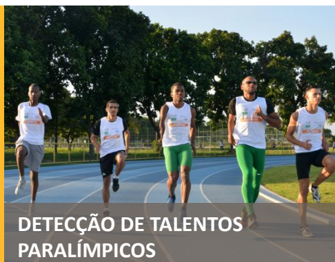
DETECÇÃO DE TALENTOS PARALÍMPICOS