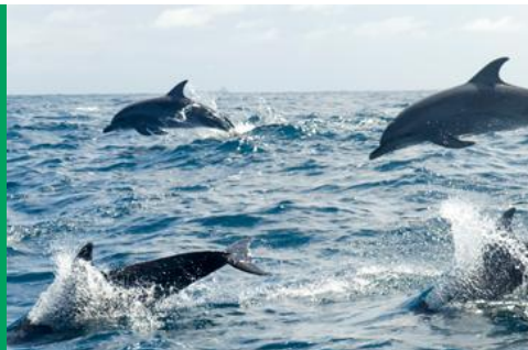
MAR | SOS MATA ATLÂNTICA