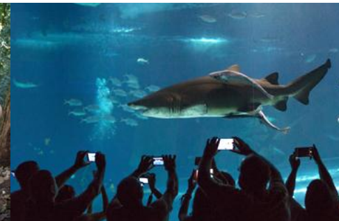
BIODIVERSIDADE | AQUARIO