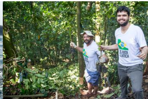
FLORESTA | SOS MATA ATLÂNTICA