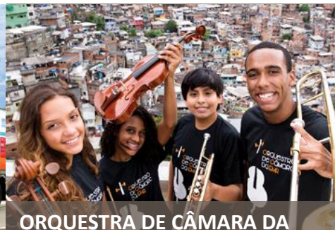
ORQUESTRA DE CÂMARA DA ROCINHA