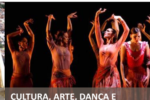
CULTURA, ARTE, DANÇA E LITERATURA