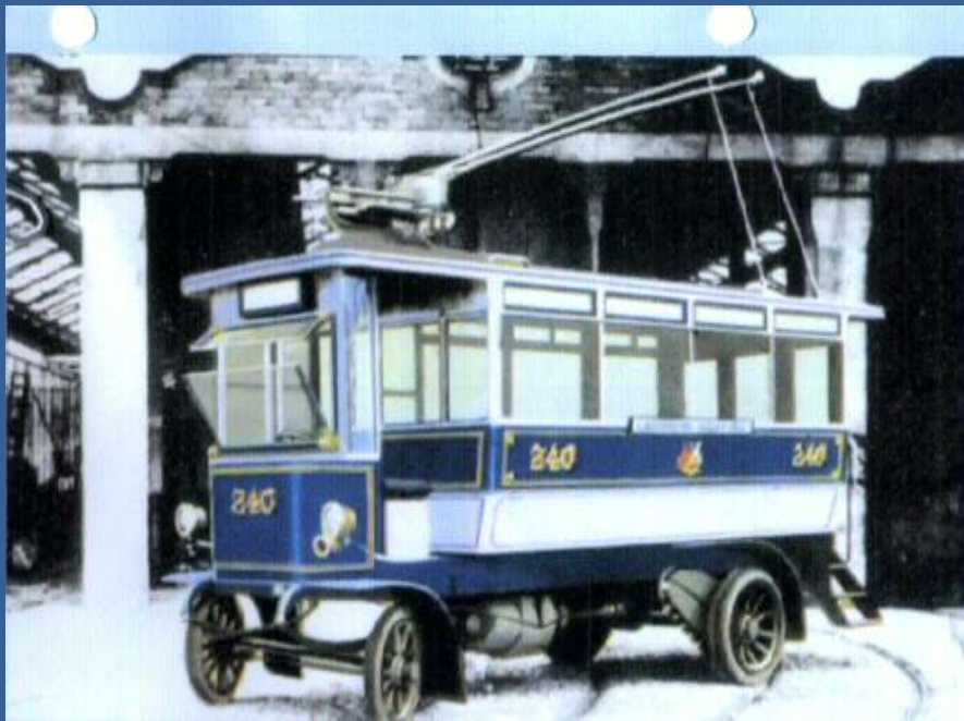
Railless Eletrec Traction – 1909 Londres - Tróleibus