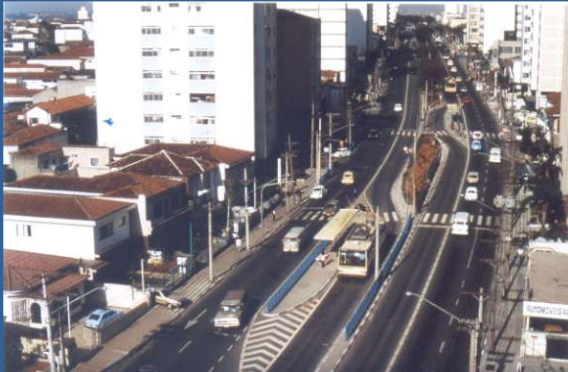
Corredor Paes de Barros