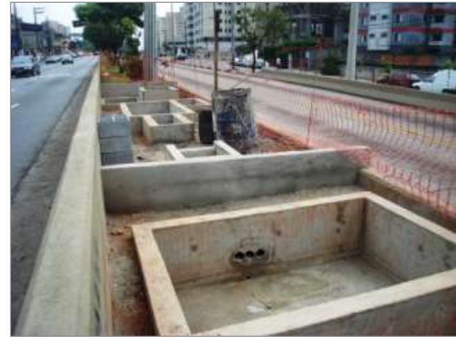
Base para os equipamentos