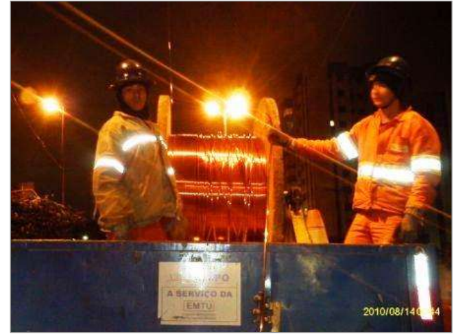
Desbobinamento e lançamento do fio trólei