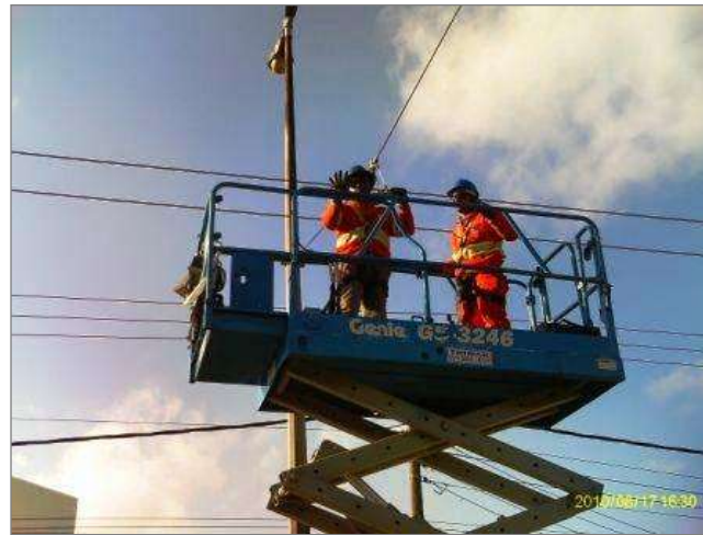
Grampeamento do fio trólei