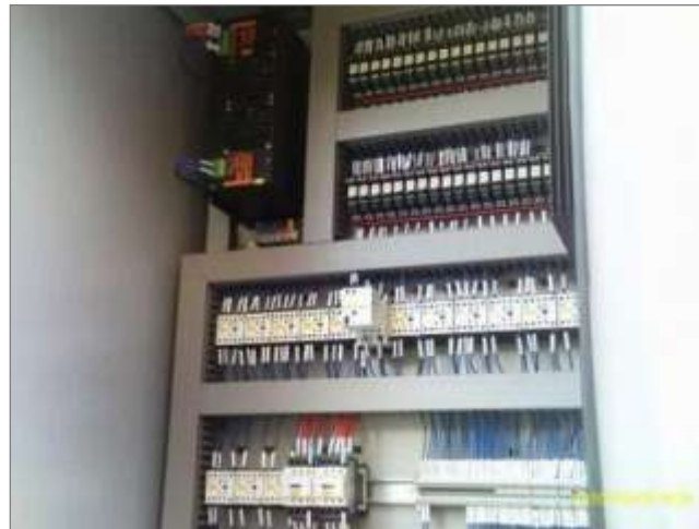
Painel de serviços auxiliares