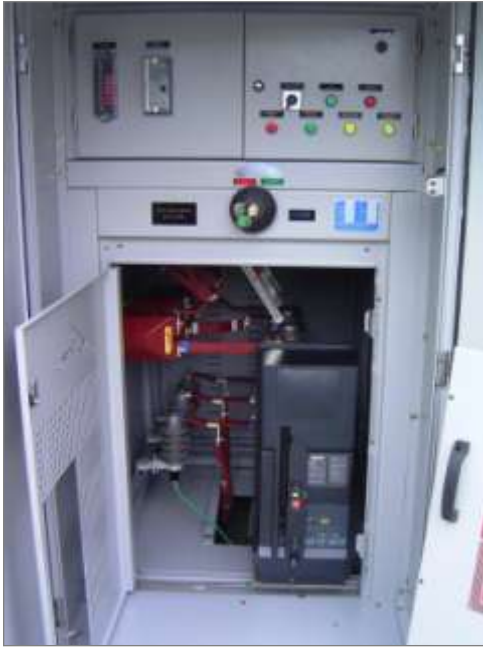
Cabine primária - Disjuntor