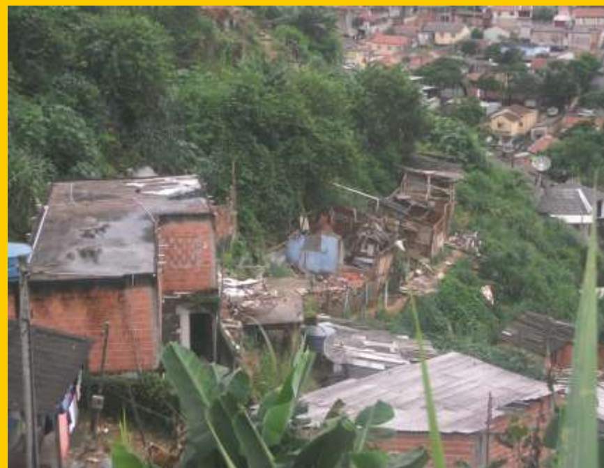
Jardim São Camilo, Jundiaí – SP