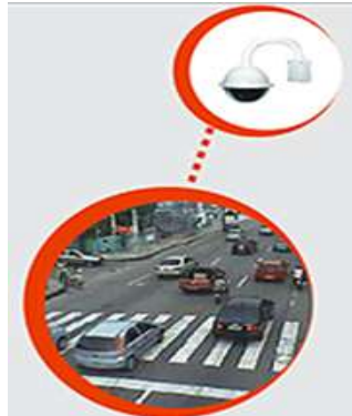
Câmera móvel inteligente